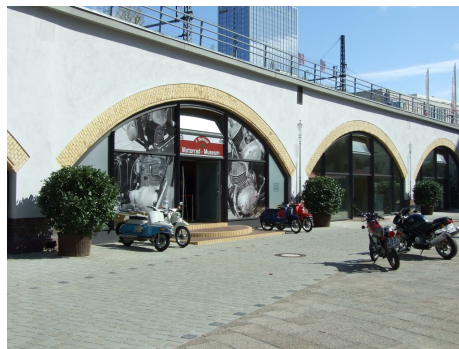
Eingang des Museums

Aber nicht nur für den Motorradliebhaber gibt es viel zu sehen und zu bestaunen. Die abwechslungsreiche Dekoration und anderen Ausstellungsstücke sind für jeden Besucher ein absolutes Highlight.